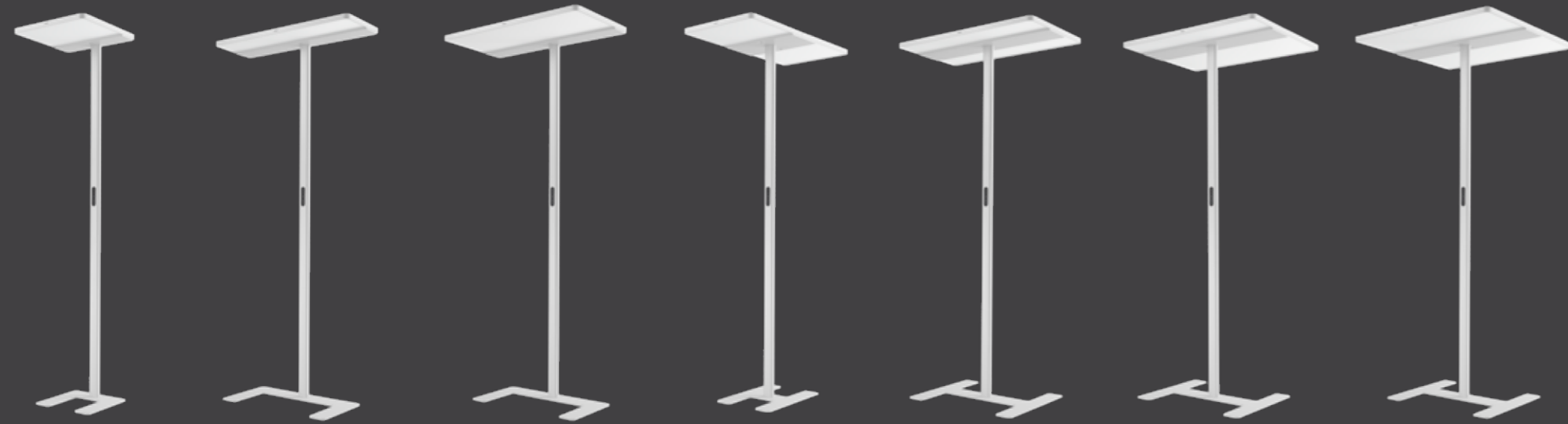
1DS 1 Desk Side